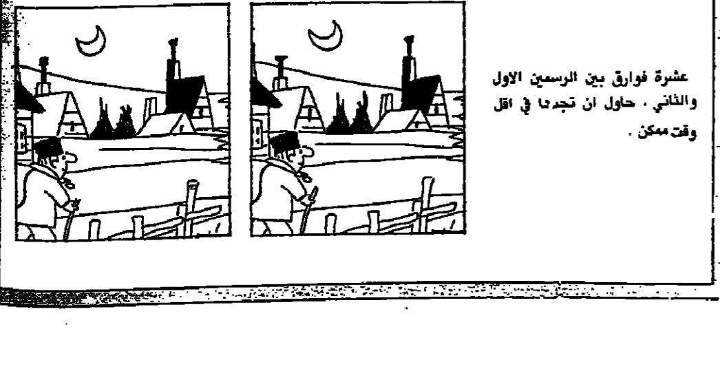
عشرة فوارق بين الرسمين الاول والثاني . حاول ان تجد في كل وقت ممكن .